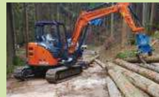
自伐用機材の導入