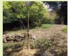
展示効果の高い森林の整備