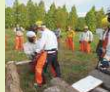
森林づくり活動安全講習会